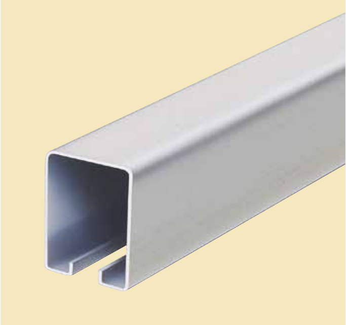
ステンレス トラックレール