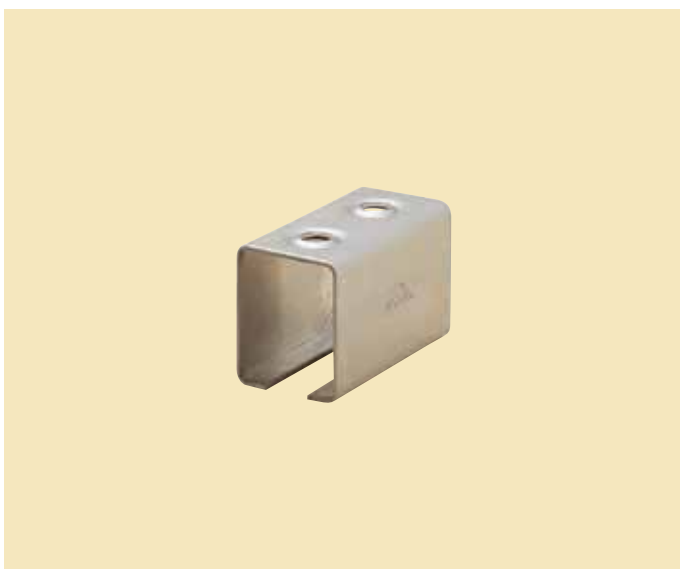
ステンレス 継ボックス受