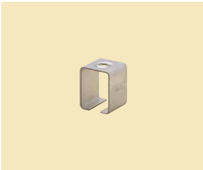
ステンレス ボックス受