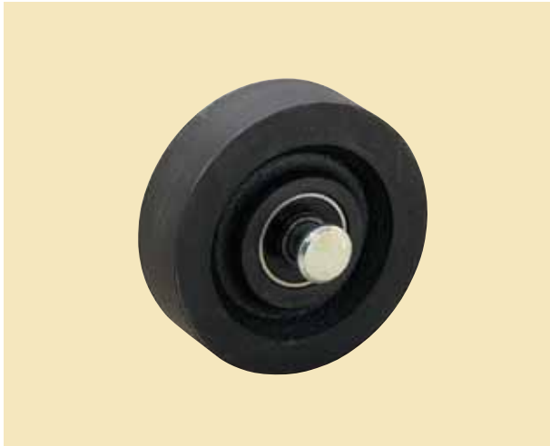
フジロイヤル重量車 平型 (車のみ) 芯棒付

R75-R150 密閉型 ベアリング 2個 R50-R60 密閉型 ベアリング 1個