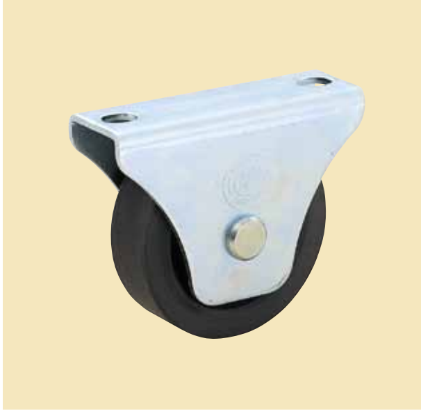
フジロイヤル重量車 平型 (枠付)

R50-R60 密閉型ベアリング 1個 R75-R150 密閉型ベアリング 2個