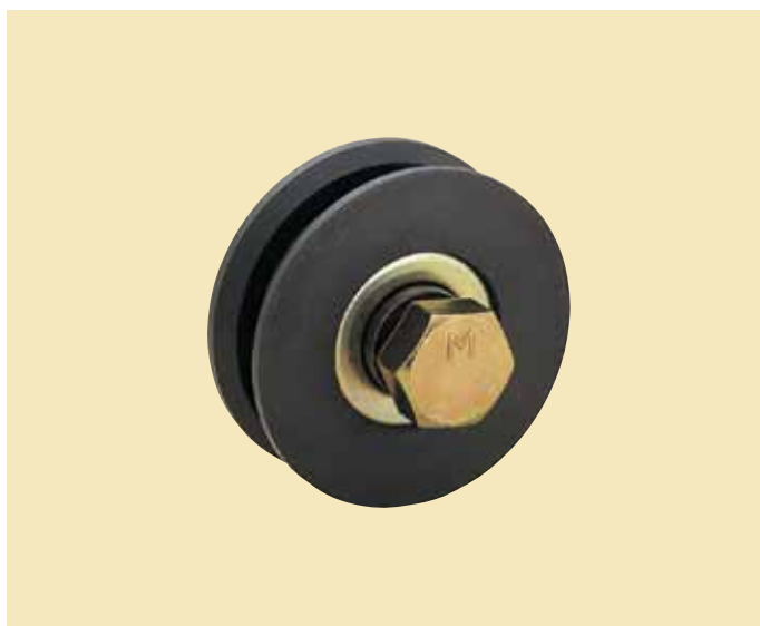
フジキング重量戸車 H型（車のみ）ボルト、ナット付