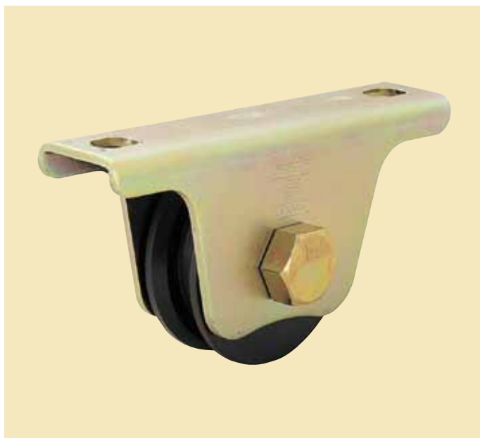
フジキング重量戸車 H型（枠付）