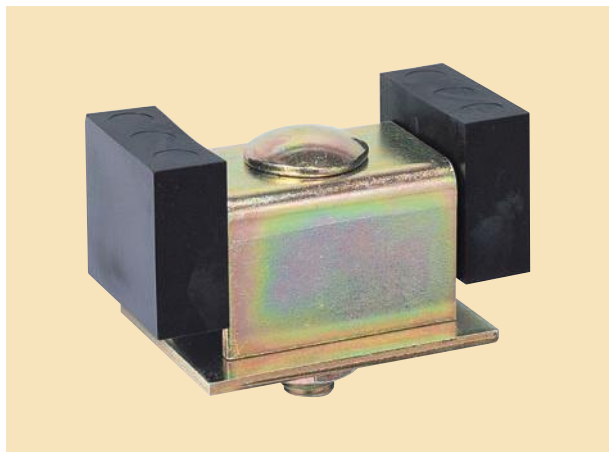
パッド付戸当りW (ダブル)