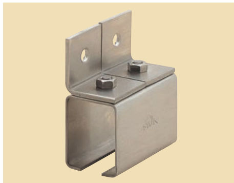
ステンレス 横継受一連