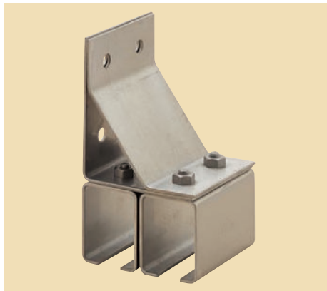
ステンレス 横継受二連