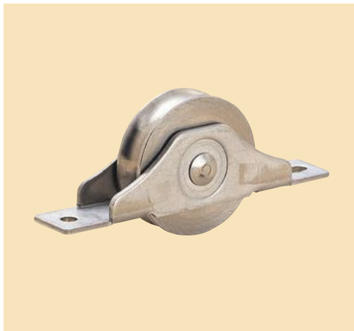
ヤボシ ステンレス戸車